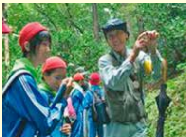
レッドデータ研修会

豊かな体験学習を中心に、いのちの教育を学ぶふるさと学習の展開。 — 独自の体験活動から、ふるさとに学ぶ—