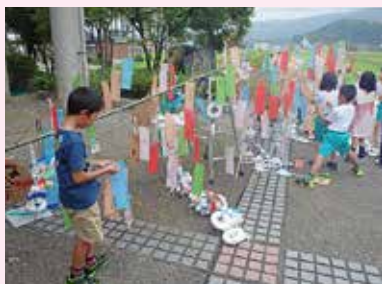
七夕かざりを作ろう

地域の文化や人に関わり、地域を愛する子供を育てる。 — 創立20年の伝統を受け継ぐひばりっ子—